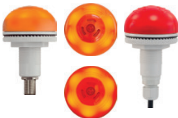
P50 A LED QC M12