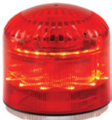
SIR-E LED MAX