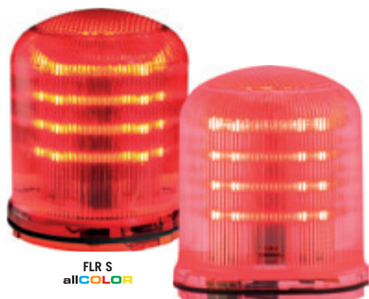
FLR S allCOLOR